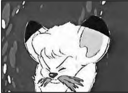
Kimba comiendo hierba.