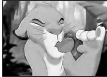
Simba comiendo insectos.