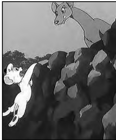
Obra de Tezuka.