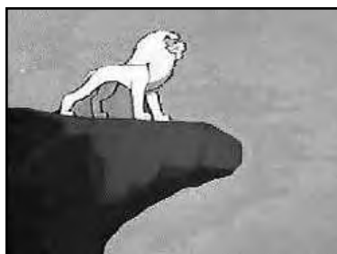
Obra de Tezuka.