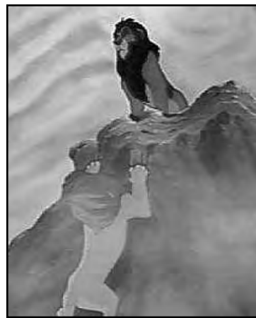
Obra de Disney.