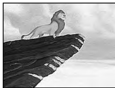
Obra de Disney.

Sangrantes. Junto a él está Mufasa, padre de Simba, que, desde los cielos, dice: “ debes vengar mi muerte Kimba, eh... digo, Simba ”.